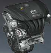
SKYACTIV-G PRZEŁOMOWY SILNIK BENZYNOWY

Nowy silnik benzynowy lepiej przyspiesza i zarazem mniej pali. Ma do 15% wyższy moment obrotowy, jest o 10% lżejszy oraz zużywa do 20% mniej paliwa. Taki wynik możliwy był dzięki mniejszej masie tłoków, korbowodów, a także mniejszemu oporom ruchu w przekładni łańcuchowej oraz efektywniejszemu chłodzeniu.