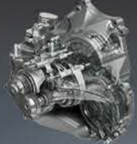
SKYACTIV-MT MANUALNA SKRZYŃNIA BIEGÓW