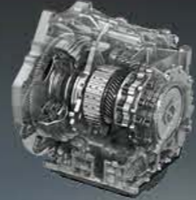
SKYACTIV-AT AUTOMATYCZNA SKRZYŃNIA BIEGÓW