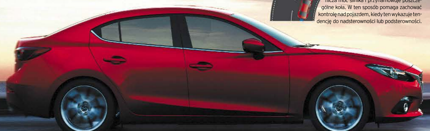
DSC - Ta technologia sprawia, że samochód zachowuje się stabilniej podczas pokonywania zakrętów lub gdy nagle musisz ominąć przeszkodę. Układ automatycznie ogranicza moc silnika i przyhamowuje poszczególne koła. W ten sposób pomaga zachować kontrolę nad pojazdem, kiedy ten wykazuje tendencję do nadsterowności lub podsterowności.