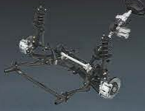
SKYACTIV-CHASSIS NOWOCZESNE PODWOZIE

Nowy silnik benzynowy lepiej przyspiesza i zarazem mniej pali. Ma do 15% wyższy moment obrotowy, jest o 10% lżejszy oraz zużywa do 20% mniej paliwa. Taki wynik możliwy był dzięki mniejszej masie tłoków, korbowodów, a także mniejszemu oporom ruchu w przekładni łańcuchowej oraz efektywniejszemu chłodzeniu.