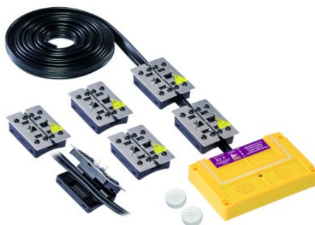
ODSTRASZACZ Z WYSOKIM NAPIĘCIEM I ULTRADŹWIEKAMI CHRONIĄCY POJAZD PRZED KUNAMI