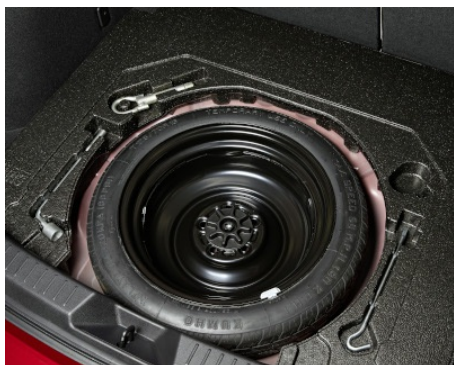
ZESTAW KOŁA DOJAZDOWEGO Z OPONĄ