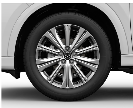
FELGI ALUMINIOWE (19) 225/55 W KOLORZE BRIGHT