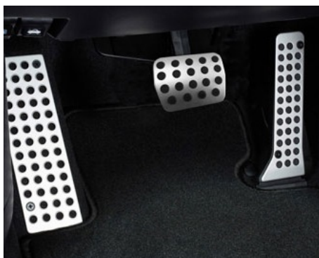
ALUMINIOWE NAKŁADKI NA PEDAŁY