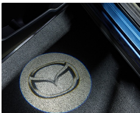
PODŚWIETLENIE DRZWI - DIODOWE