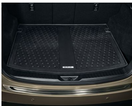
MATA OCHRONNA BAGAŻNIKA