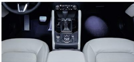
PODŚWIETLENIE POWITALNE - DIODOWE