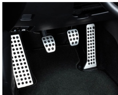
ALUMINIOWA PODPÓRKA STOPY