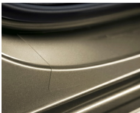
FOLIA OCHRONNA PROGÓW