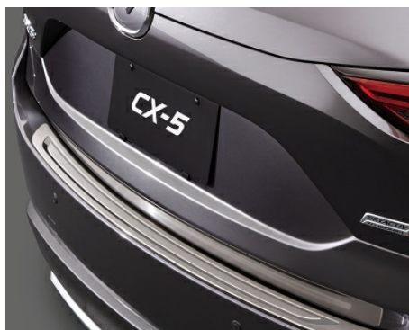
LISTWA OCHRONNA TYLNEGO ZDERZAKA