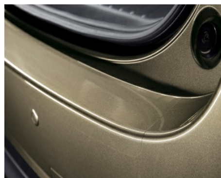
FOLIA OCHRONNA TYLNEGO ZDERZAKA