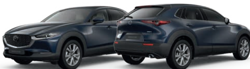
DEEP CRYSTAL BLUE