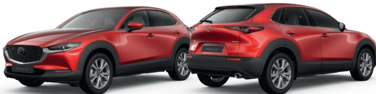
SOUL RED CRYSTAL